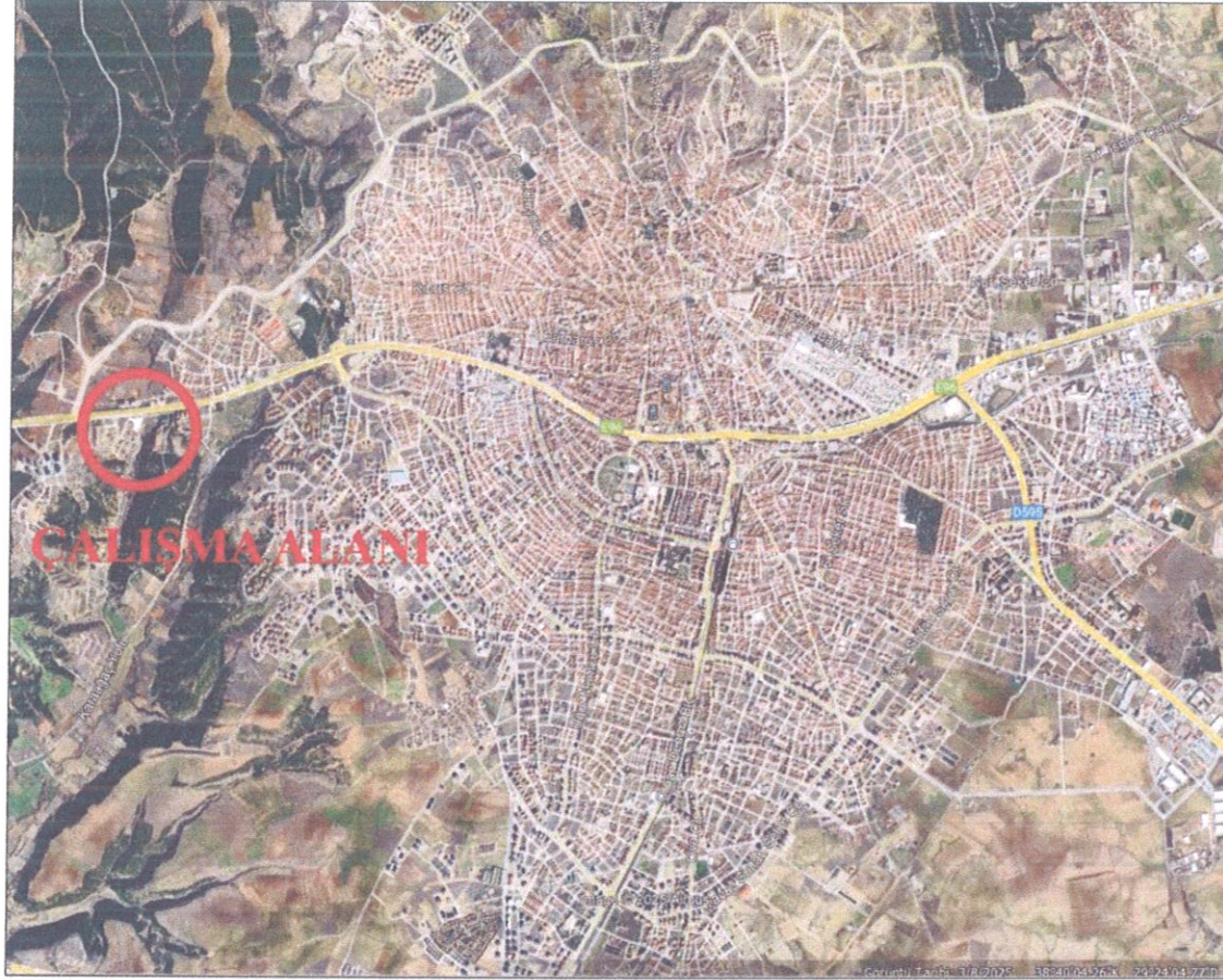
Şekil 2. Çalışma Alanının Konumu

Çalışma alanı kent merkezinin batısında yer almaktadır. Çalışma alanı kent merkezine yaklaşık 3.8 km uzaklıkta bulunmaktadır. Ayrıca kentin merkezinden geçmekte olan İzmir-Ankara yolu üzerinde bulunmaktadır.