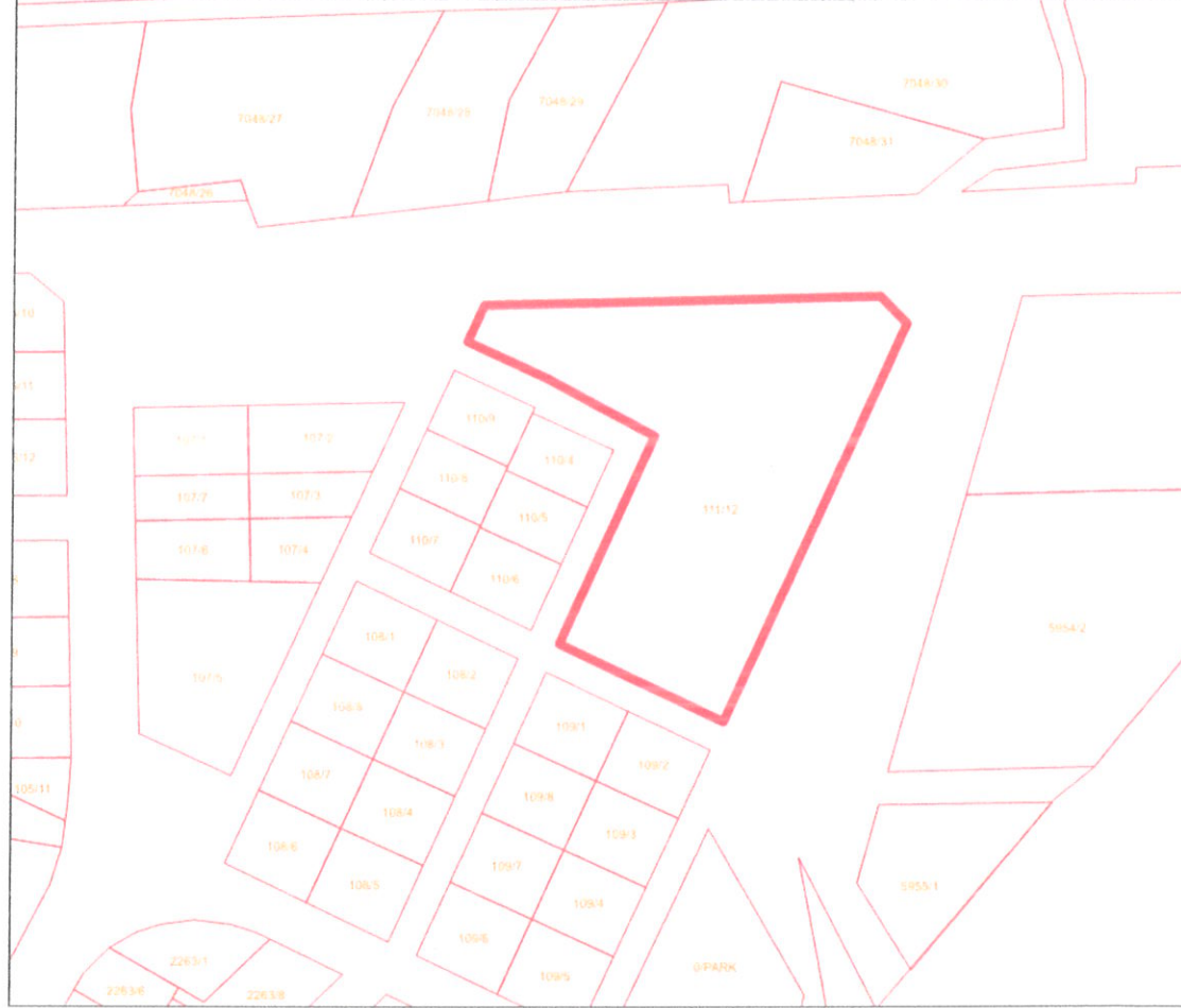
Şekil 3. 111 Ada 12 Parsel Kadastral Durum