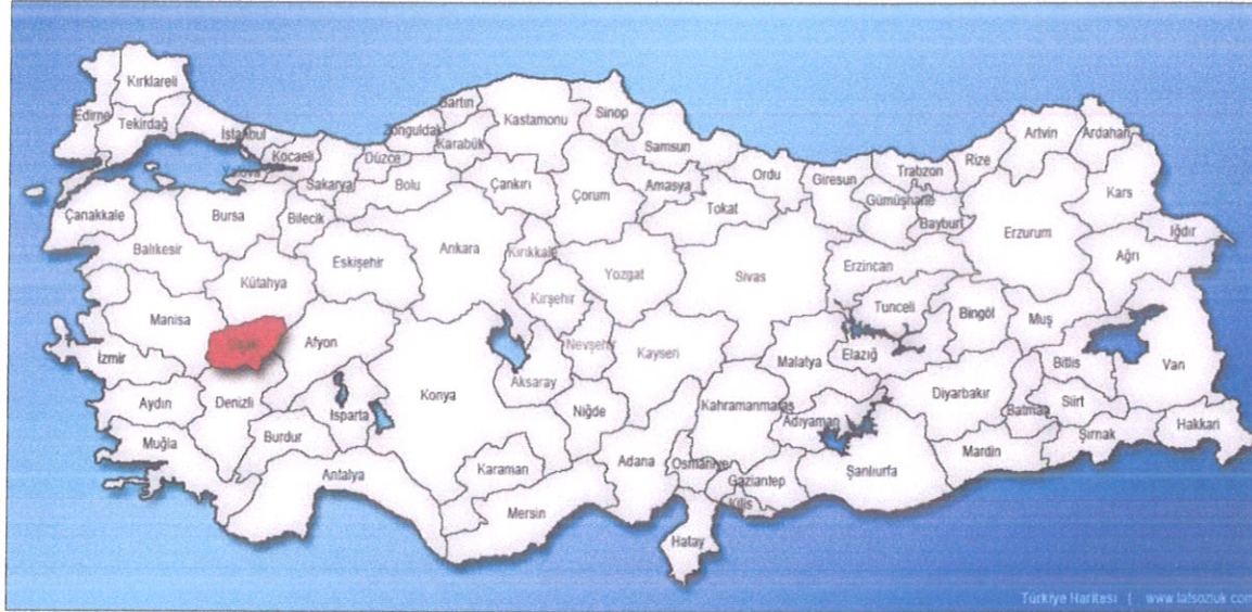
Şekil 1. Uşak İli Konumu

Uşak ili, Ege Bölgesinin İç batı Anadolu bölümünde, Ege Bölgesi ile İç Anadolu bölgesinin birbirlerinden ayrıldığı İç batı Anadolu eşığının batı kenarında, 38 derece 13 dakika ve 38 derece 56 dakika enlemleri ile 28 derece 48 dakika ve 29 derece 57 dakika boylamları arasında yer alır. Kuzeyde Kütahya, doğuda Afyon, güneyde Denizli ve batıda Manisa illeri bulunmaktadır. 5 341 km 2'alanına sahip olan Uşak yüzölçümü itibarıyla iller sıralamasında plaka numarası gibi 64. sıradadır. Ülke yüzölçümünün % 0.7 lik kısmını oluşturmaktadır.