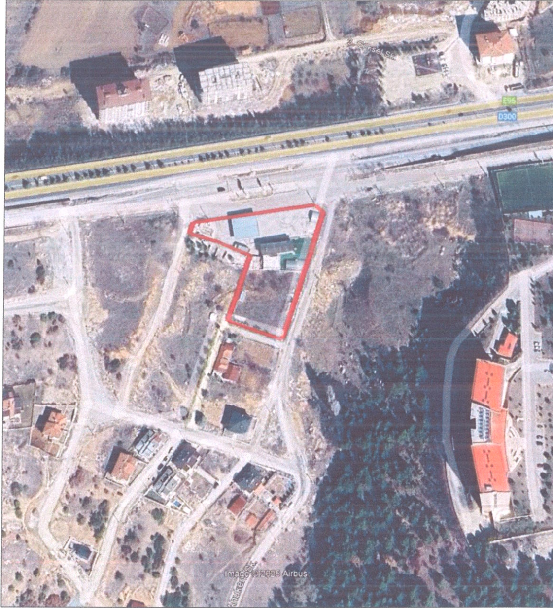
Şekil 8. Uydu Görüntüsü

İmar planı değişikliği alanı yaklaşık olarak 1416 m 2 'dir. Parsel mülkiyeti özel mülkiyete ait olup, mevcut durumda parselin kuzeyinde akaryakıt istasyonu bulunmaktayken, parselin güneyinde herhangi bir yapılaşma ve inşaat faaliyet bulunmamaktadır.