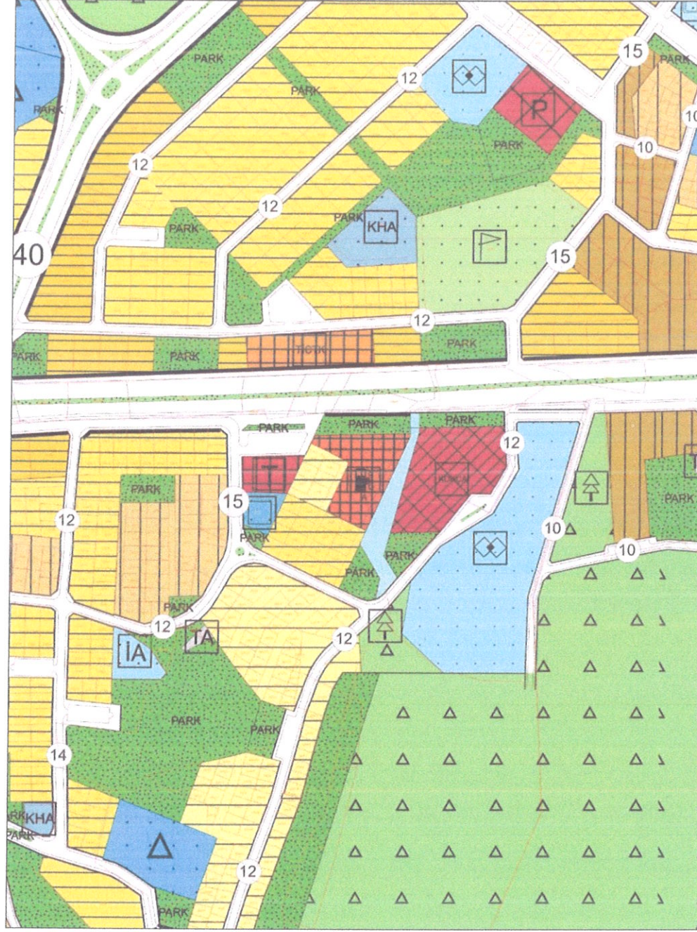
Şekil 6. Mevcut Nazım İmar Planı Durumu

Bahse konu Uşak İli Merkez İlçesi Hacıkadem Mahallesinde yer alan 111 ada 12 parsel, mevcut 1/5.000 Ölçekli Nazım İmar Planında "Akaryakıt ve Servis İstasyonu Alanı" olarak bulunmaktadır.