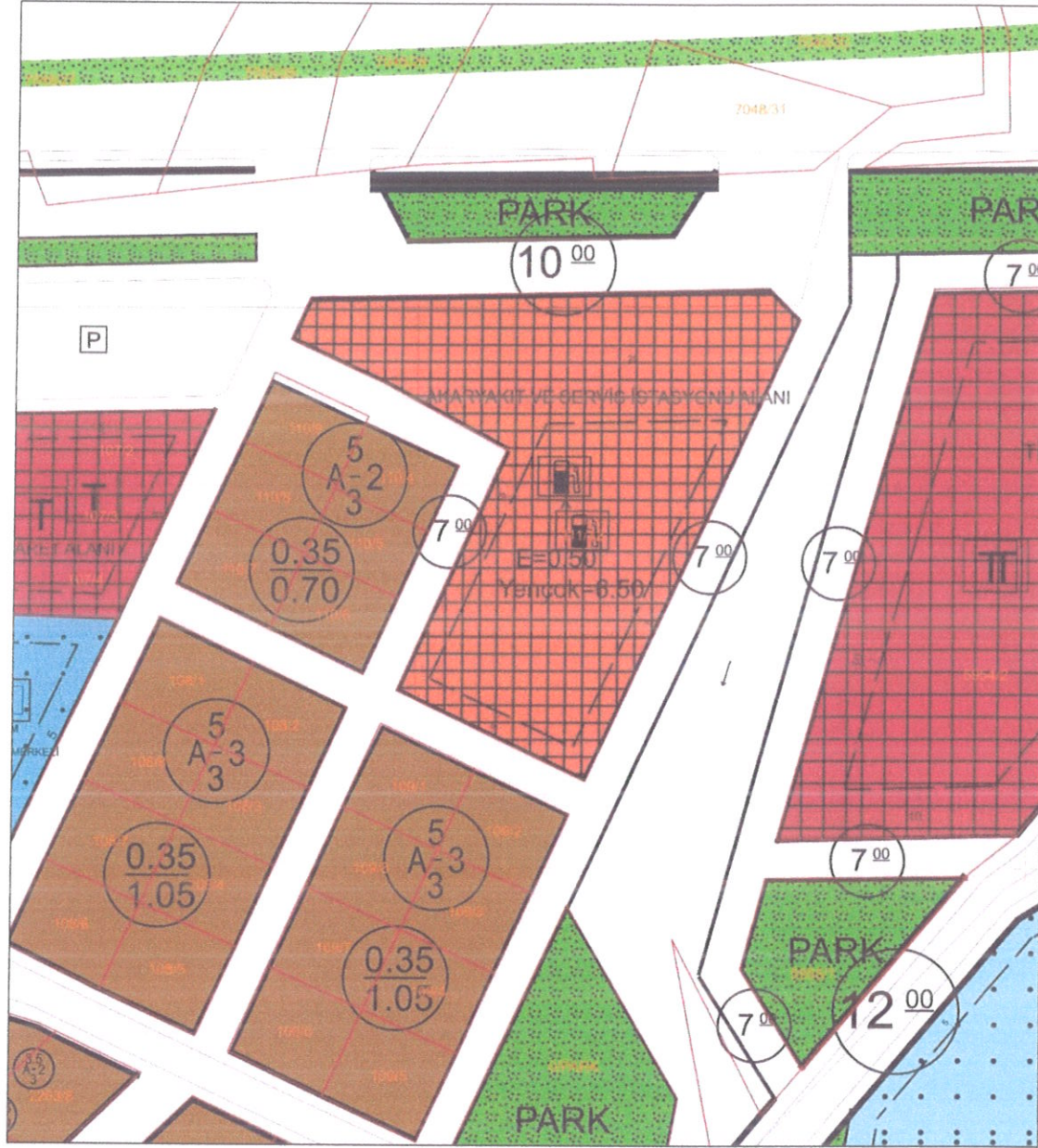
Şekil 7. Mevcut Uygulama İmar Planı Durumu