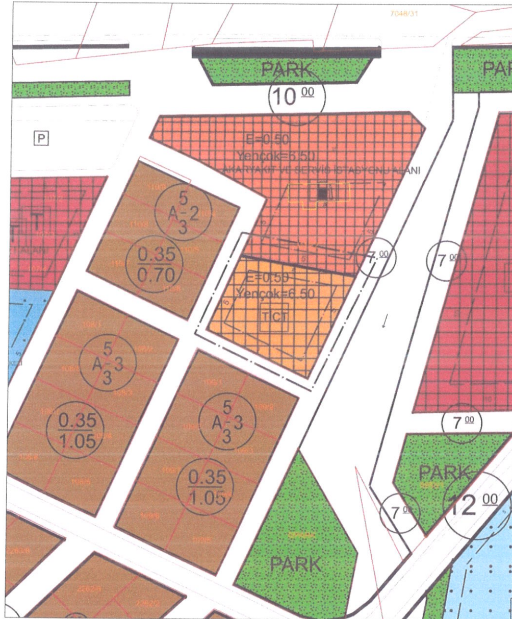
Şekil 9. Öneri Uygulama İmar Planı Durumu